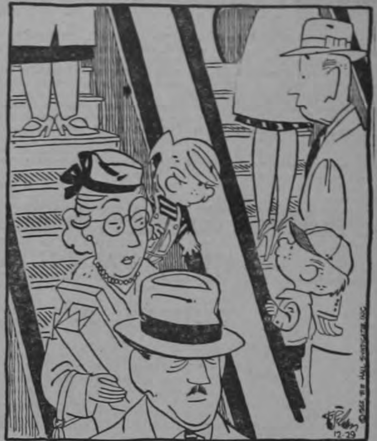
Si no te apuras no me alcanzarás nunca...