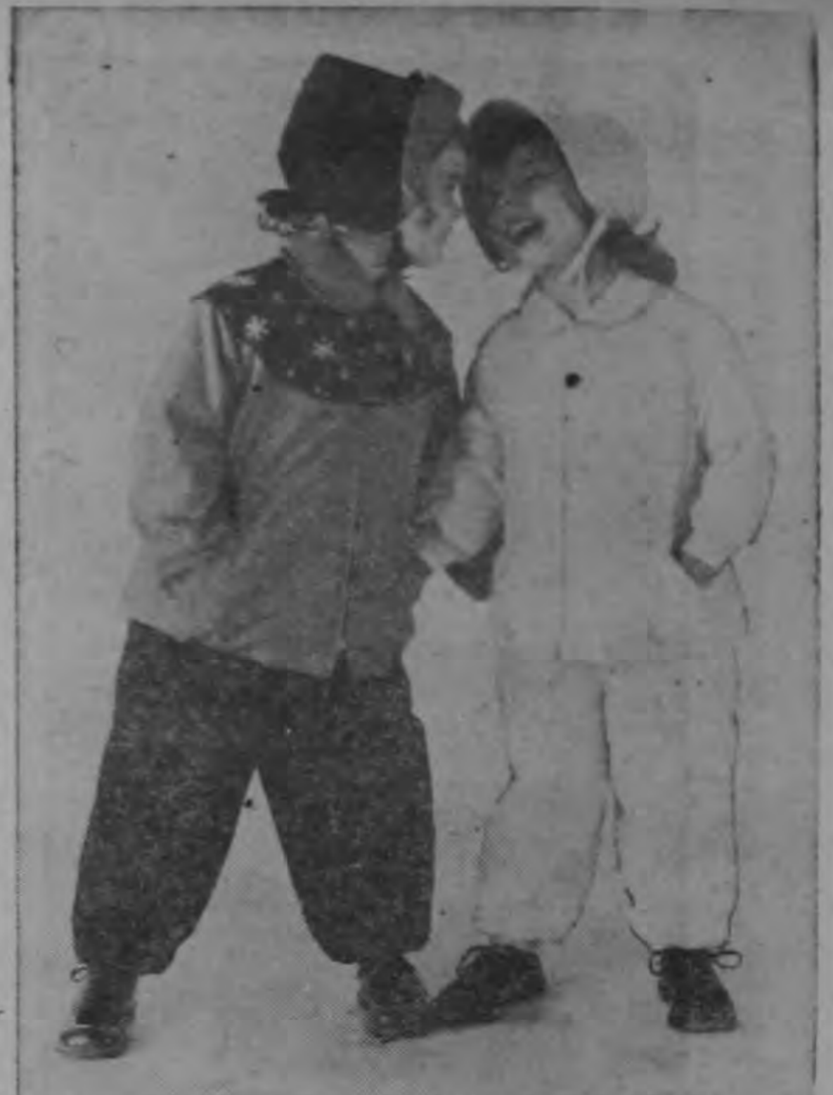
MODAS DE INVIERNO. — Dos trajes para niñas, diseño de Jewel Togs, de Nueva York. A la izquierda, conjunto de pantalón y chaquet, que tiene ancho cuello en el cual aparecen bordados cristales de nieve; un bonete completa el equipo. A la derecha, traje blanco, de una sola pieza, de nylon, especial para jugar a la intemperie.