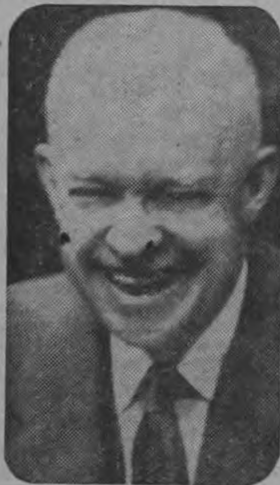
El Presidente Eisenhower ríe con ganas al decirle a los periodistas en Washington que acepta la postulación como candidato para un segundo período presidencial.