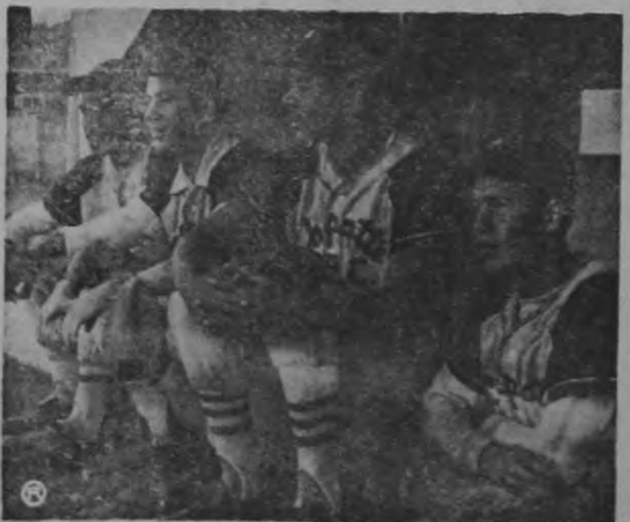
La cámara sorprende a los peloteros del Chapatte esperando turno descosos de conectar muchos batazos largos que signifiquen la victoria de su novena. Realmente el triunfo llegó para ellos después de ruda lucha por tres carreras contra dos en bonito desafío.

Gigantes se apuntó el triunfo sobre el CANADA DRY por once carreras contra ocho, definiéndose el juego en extra-inning.— CHAPATTE logró vencer a su tradicional rival NUEVE ESTRELLAS en bonito juego por tres carreras contra dos.