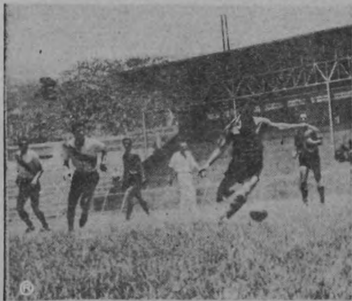
El duro zaguero central Vivo Quesada vuelve a lucir en gran forma en la defensa manuda. Aquí lo vemos entrando al despeje con su característica energía que tanto respeto le ha ganado entre todos los delanteros de los equipos mayores de futbol.