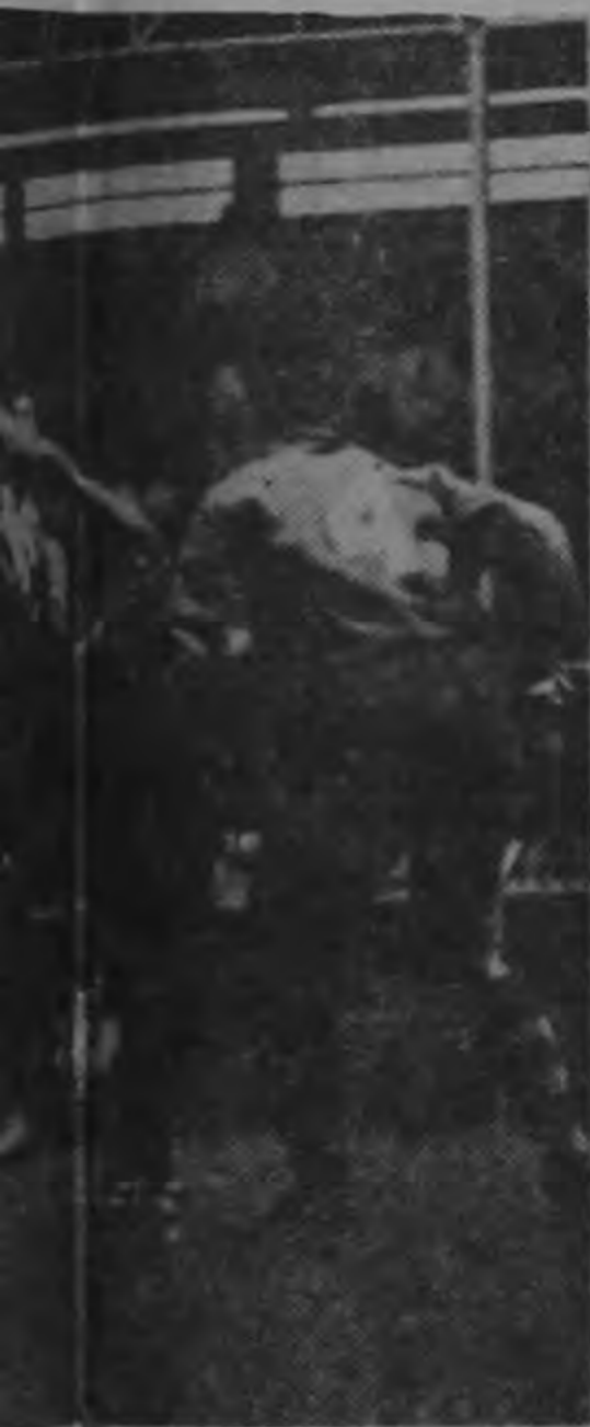
... valentía el zaguero central Mancho Esquivel despeja con cabeza un centro de juego de su rival.