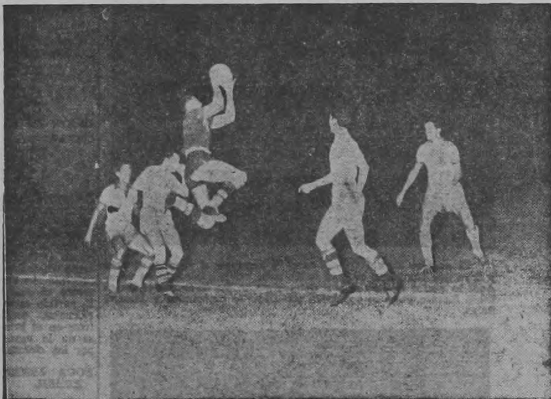
CIUDAD DE MEXICO, Marzo 13 (INP) — El portero costarricense, Pérez, atrapa una pelota dando un salto felino, para evitar que los brasileños anotaran otro gol en el partido que su equipo ganó por 7-1 contra los cariocas, durante el Torneo Panamericano de Fútbol.