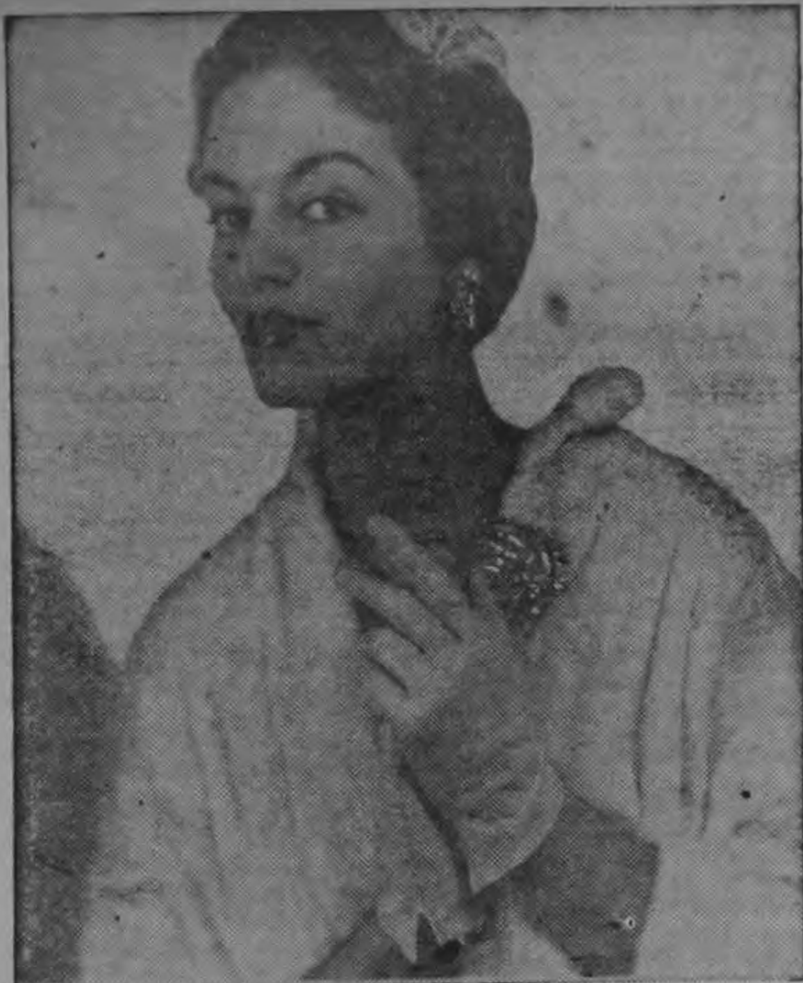
LA MODA FRANCESA. — Guantes franceses, cortos, lavables; llevan un adorno de piedras de colores, que se escogen de acuerdo con el traje con que se piensan usar.