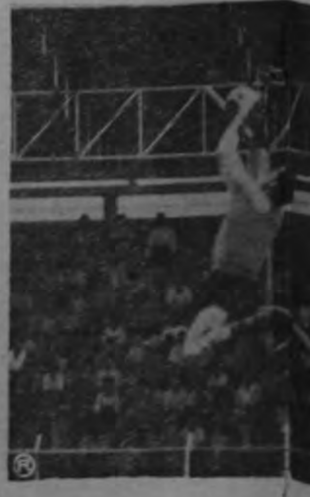
El novel arquero manudo Moisés muestra notables cualidades atléticas. Véase en esta telefoto como salta espectacularmente para anular a Esquivel, absoluta un remate alto de los delanteros.