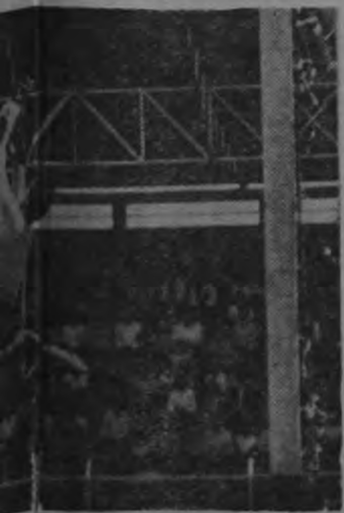
Montoya reveló en este partido notablemente y se lleva con seguridad los delanteros florenses.